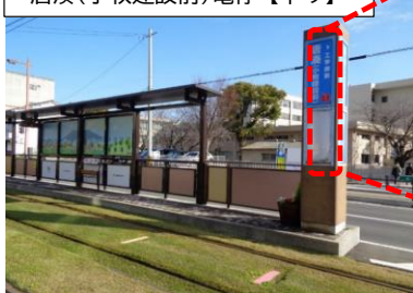
唐湊(小牧建設前)電停【下り】

待合所から撮影した電停標識 ※上り・下り合わせて計8面に 電停名(副呼称)が表記されます。