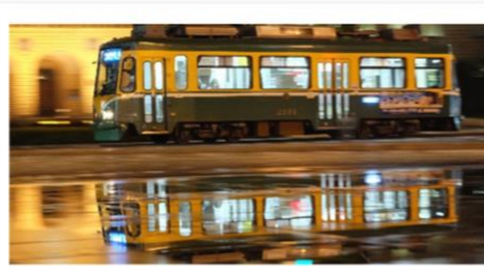
前年度 優秀賞作品 「MIZUASOBI～夜に駆ける～」