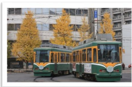
前年度 最優秀賞作品 「100年目の秋を走る」