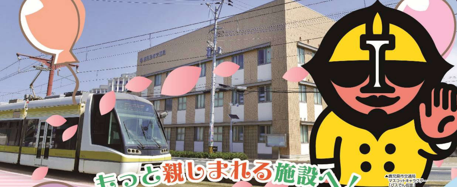
▲鹿児島市交通局 マスコットキャラクター 「バスでんば」