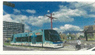
前年度 優秀賞作品 「スカイブルー×ストラスフル」