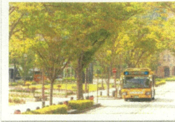
前年度 最優秀賞作品 「木漏れ日のトンネル」