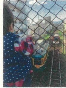
前年度 優秀賞作品 「僕の散歩道」