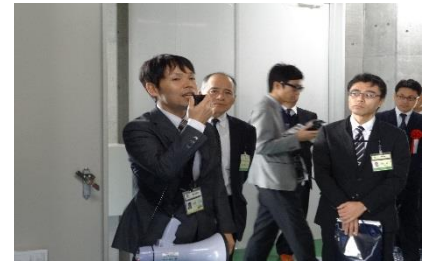
○施設内見学会の様子